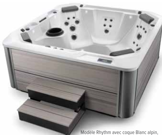
Modèle Rhythm avec coque Blanc alpin, habillage Amande et marche de la collection Hot Spot Amande.