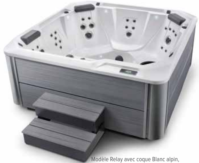
Modèle Relay avec coque Blanc alpin, habillage Gris orage et marche de la collection Hot Spot Gris orage.